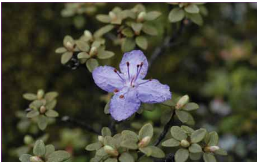
Rh. nitidulum på Gongga Shan 28. maj

Nu kører vi hurtigt nedad Wolong Shan massivet, så det er slut med at finde flere Rhododendron på denne tur. Tilbage er kun at skrive, at resten af turen gik planmæssigt, og selv om ude er godt er hjemme nu bedst.