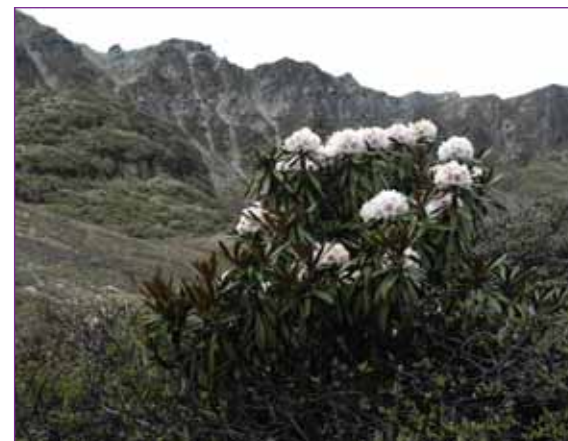
Rhododendron globigerum i næsten 5000 meters høj

Man kan høre på vejtrækningen, at man ikke skal tale og gå samtidig. Der er to pas deroppe, og da vi passerede det første, skiftede vejret, og vi skiftede også, fra oprullede skjortearmer til regntøj. Jeg nåede at få mine regnbukser på, men det var der andre, der ikke gjorde, og det blev en våd tur for dem. Regnen silede ned resten af dagen, så hvert skridt, man tog, skulle gøres med den aller største forsigtighed. Vi kom videre op og fandt oppe ved pas nummer