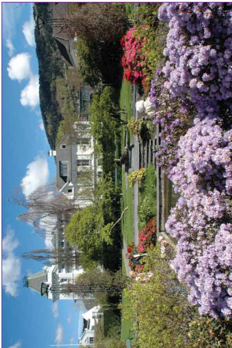
Deilig vår i Muséhagen