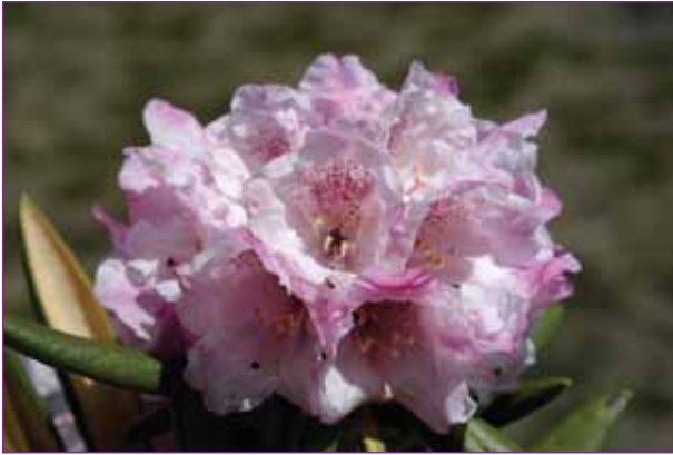
Rhododendron aganniphum var. flavorufum .

to masser af Rh. globigerum . Jeg synes, de ligner forvoksede Rh. proteoides , med blade der er lige så nedrullede i kanterne. Vi kravlede rundt på den glatte klippe-side, indsamlede frø og småplanter, fotograferede og brugte en masse papir til at tørre linserne af med. Den sidste højde, jeg tog, var 4684 m.o.h. N 28 25