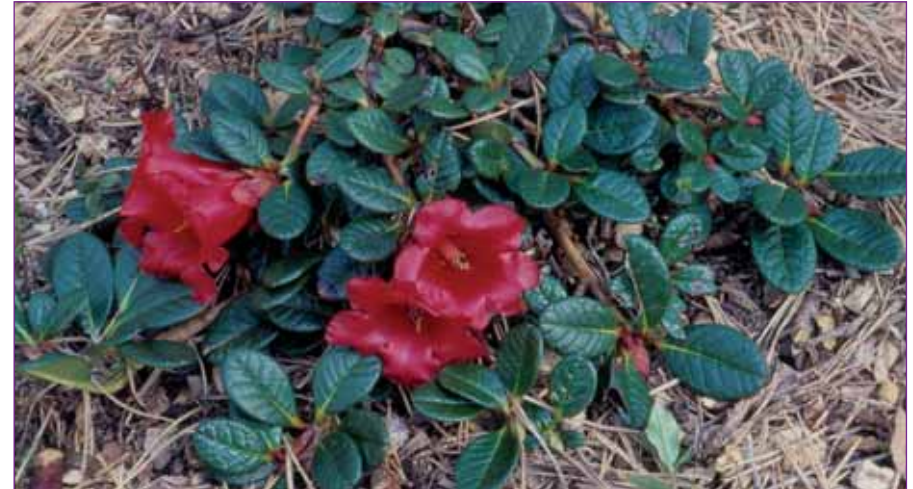
Rh. Forrestii var. repens Foto Knut Fægri.

Ikke alle plantesamlere fikk en rolig alderdom i gamle England puslende med herbariark og annet materiale de samlet gjennom livet. Noen ligger begravd i fjerne land der de også la ned det meste av sin yrkesaktive gjerning. George Forrest er en av dem. Han døde en naturlig død i Kina i 1932, og det er nesten utrolig når en vet hva han opplevde av farer på reisene sine.