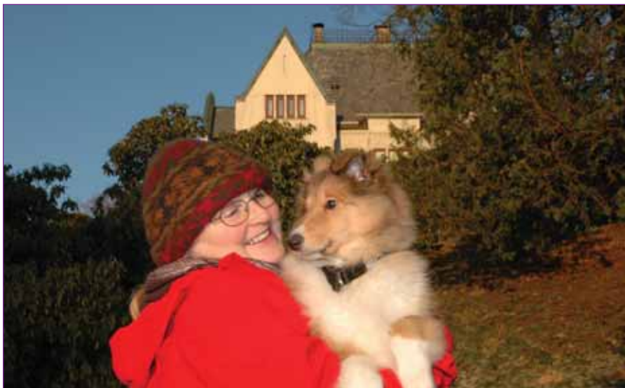
Nå blir det mere tid til å ture med vår nye collievalp, Narnia. Hun har allerede besøkt parken ved Gamlehaugen flere ganger!

Jeg ønsker dere i redaksjonen og styrene lykke til med arbeidet fremover og takker for meg.