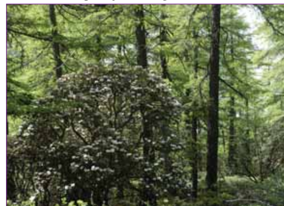
En Rhododendron aganniphum i den nyudsprungne lærkeskov på vej op mod et pas i 5000 meter. Her er vi blot i 4100 meter.