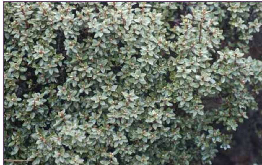
Rh. nitidulum var. omeiense , fotograferet på Mt. Omei