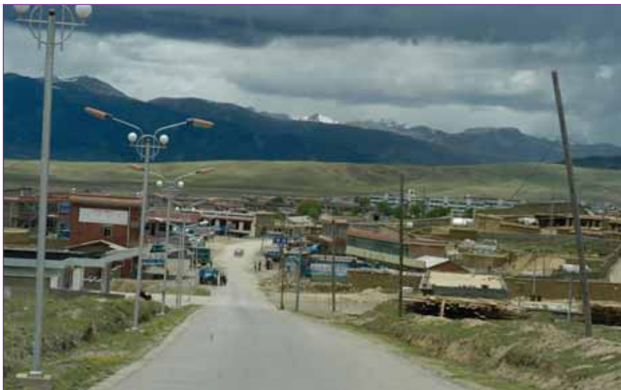
Udkanten af verdens højst beliggende by Litang 1. juni 2005.

Den 3. juni og vi har fået det første morgenmåltid her i basecamp; det var det samme som i går aften, dog var smørtheen udskiftet med pulverkaffe. Hvad bestod så sådan et måltid af? I en lille skål var der lidt grøntsager og tynde skiver af kartofler og dåsekød; det hele kogt i en tynd suppe, som var meget salt. Det blev spist, dog uden den store jubel. Men det viste sig, at vi lige så godt kunne vænne os til det, for det var det eneste vi fik.