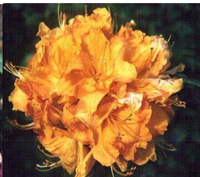
'Klondyke' (Azalea) Blomstringstid: Juni Størrelse: 1m høy etter 10 år Opphav: Exbury