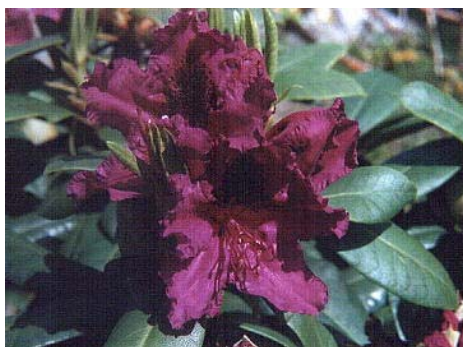
'Azurro' Blomstringstid: Juni Størrelse: 110cm høy etter 10 år Hardførhet: -26grader C Opphav: 'Danamar' x 'Purple Splendour'