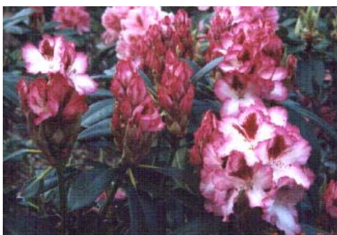
'Hachmann's Charmant' Blomstringstid: Juni Størrelse: 110cm høy etter 10 år Hardførhet: -26grader C Opphav: 'Diadem' x 'Holger'