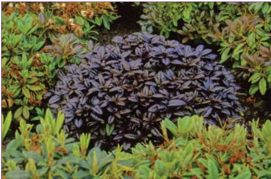
Bildet viser en av de rødblada hybridene i prøvefeltet i Glendoick.

Blomstene vil selvsagt ikke være det sentrale med slike planter. De vil komme til å være rosa/røde og tilføre lite til planten. Peter Cox mener at rent hvite blomster på en slik plante ville være den ultimate drøm, men at dette ligger langt fram i tid – om