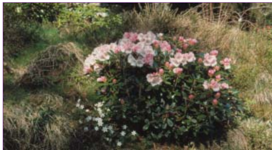
Rh. 'Queen Bee' i Tjorehagen.