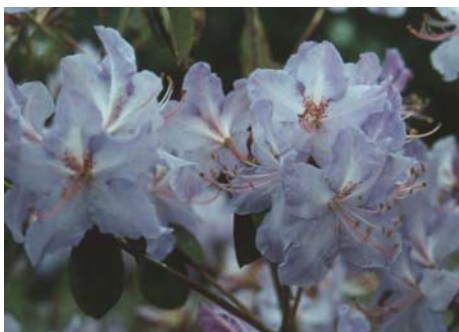
R. augustinii , SS.Triflorum