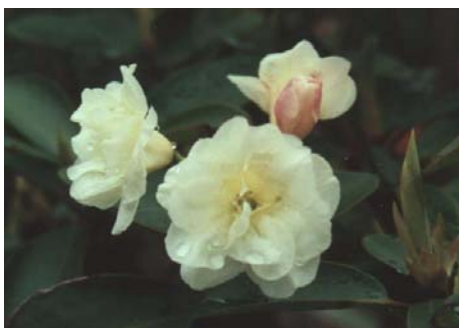
R.'Creamy Chiffon', campylocarpum -hybrid.

Vårt eksemplar av R. augustinii er av formen 'Barto Blue', og er oversådd med store, sommerfugllignende, røklå blomster i mai. Etter tolv år er det 180 cm høyt, litt uregelmessig i veksten, men nærmest bredt søyleformet. Hører til dem som stjeler mest oppmerksomhet! Arten har navn etter Augustine Henry som fant den i Hupeh-provinsen, Kina, i 1886.