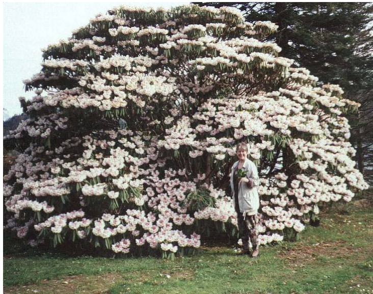
R.calophytum , Hareid på Sunnmøre

I Kina kalles den for mêi róng dùjuān som kan oversettes med "vakkert